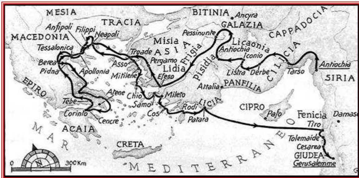
Cencre è il porto di Corinto

La madre di Simone capisce il messaggio di Gesù, che non è venuto, per essere servito, ma per servire, non per esercitare un potere, ma per aiutare gli altri. Questa donna comprende Gesù, mentre Pietro non afferra il suo messaggio e assumerà sempre un atteggiamento di contestazione nei suoi riguardi.